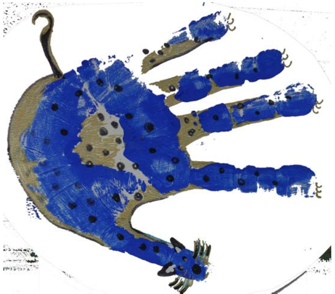
la main de léonie