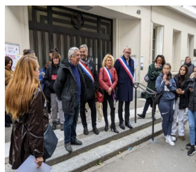
Rassemblement contre la fermeture du lycée Théophile Gautier (12 e ) le 18/11/2022 en présence d'Attac 12

En parallèle, la région Ile de France de Valérie Pécresse entame un vaste plan de fermetures de lycées professionnels dans Paris (et dans le 12 ème )